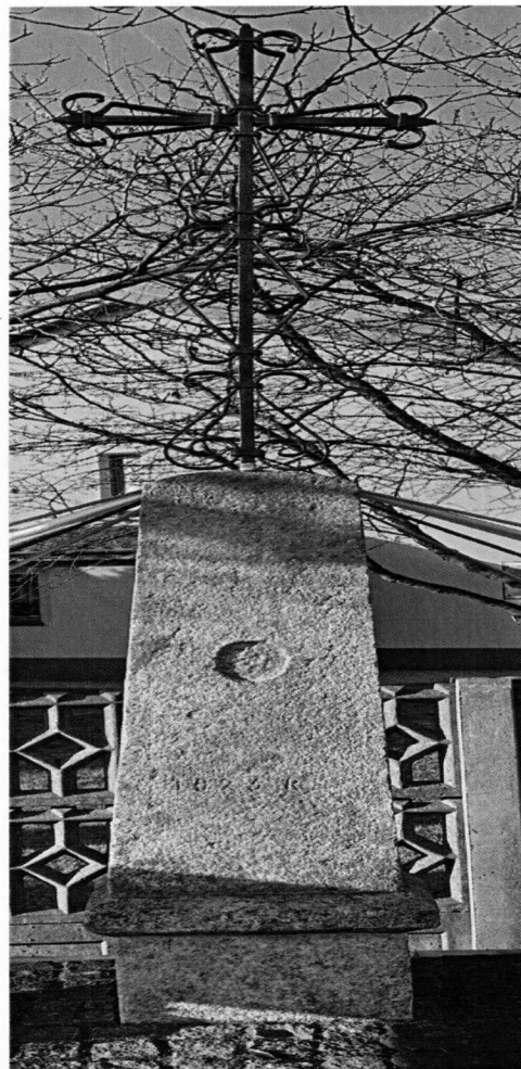
Fotografie przedstawiają stan zachowania kapliczki przed wykonaniem prac konserwatorskich i po ich zakończeniu.

Program prac konserwatorsko-restauratorskich obejmował: