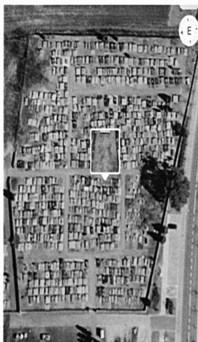
Zdjęcia grobu Nieznanego Partyzanta oraz jego lokalizacji.